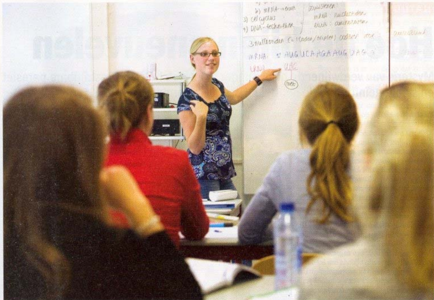
De docenten van de eindexamencursus aan de Universiteit van Leiden zijn slim: ze moeten zelf gemiddeld een 8,5 hebben behaald op hun eindlijst

liteit van veel scholen tekortschiet. Zo wil Huibregtse niet gaan. Het komt in de bovenbouw steeds vaker voor dat leerlingen enkele maanden geen les krijgen omdat er geen leraar is, zegt hij. 'Daar kunnen die scholen niet zoveel aan doen: er is nu eenmaal een uittocht gaande van leraren.' Die leerlingen kunnen onder meer in Leiden in drie dagen hun kennisachterstand wegwerken.