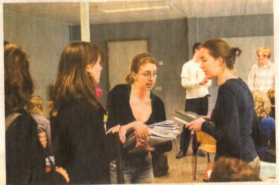
De deelnemers komen uit heel Nederland, van Groningen tot Maastricht.